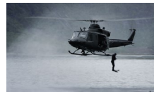
PXXXX Ny heli.kap. Utbetalinger fra 2024