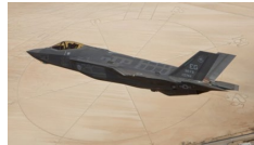
F-35 Leveranser til 2024