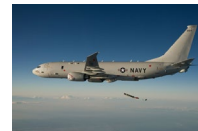
P2048 P8 oppgrad. Utbetalinger fra 2025