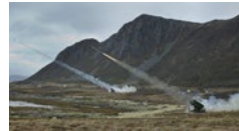
PXXXX Bakkebasert LV Utbetalinger 2021-2031