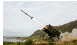
P7627 Langtrekkende LV Utbetalinger fra 2029