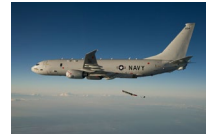
P2047 Videref. MPA Leveranser 2022-2023