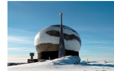
P2078 Sensorer luftr. Leveranser 2025-2029