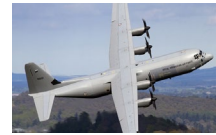
P7820 MLU C-130J Utbetalinger 2025-2029