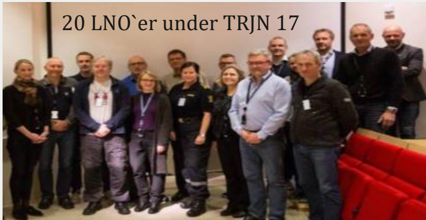
20 LNO`er under TRJN 17